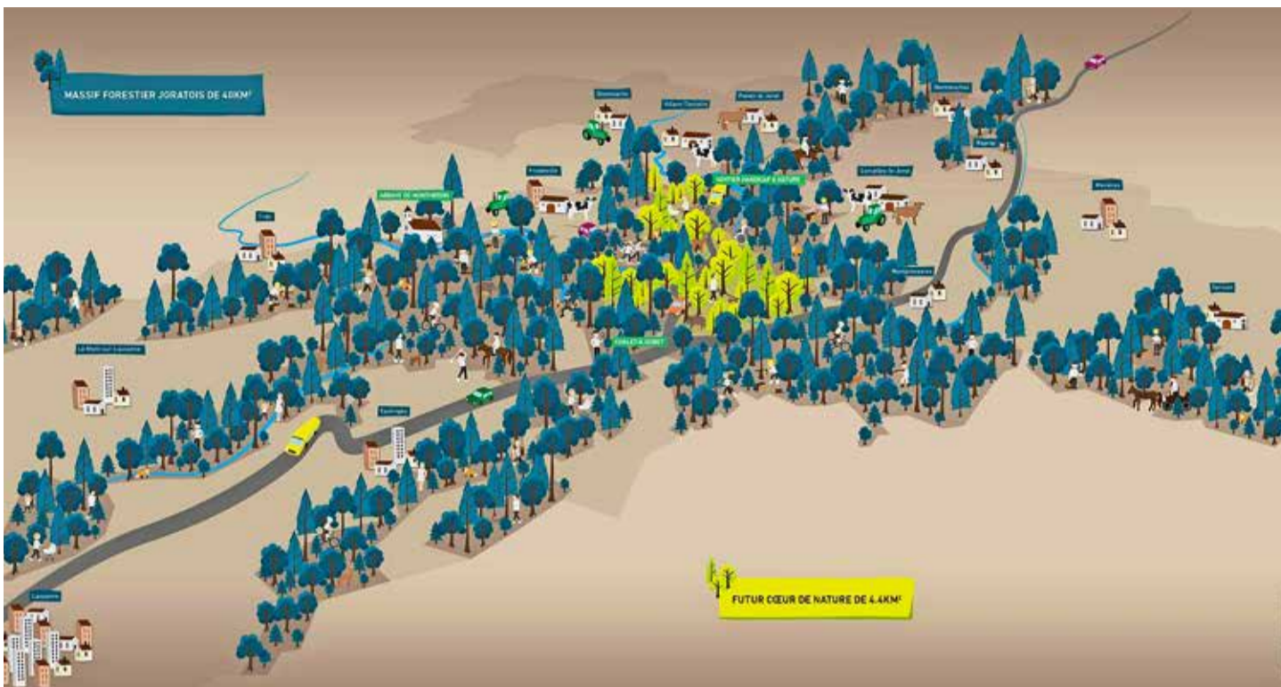
Représentation du massif forestier des Bois du Jorat et de la future zone centrale de 440 hectares.

C'est l'association JUTAVAQ (Jorat, une terre à vivre au quotidien), créée en 2012, qui est chargée de la planification du projet. Treize communes en font partie ainsi que l'Etat de Vaud en tant que propriétaire forestier. Cinq commissions se partagent les réflexions: garantie territoriale, scientifique et technique, communication, éducation et relations publiques, conciliation ainsi que bois, économie et tourisme. En février 2015, l'association a pu déposer un dossier de candidature à la création du parc. Ce dernier a été étudié par l'OFEV qui a émis un avis favorable. A l'automne 2015, le parc naturel périurbain du Jorat a donc obtenu le statut de «parc candidat». A compter de ce jour, un délai de quatre ans était donné à l'association pour mettre sur pied le projet qui sera présenté à l'automne 2019 au Législatif des communes concernées. La forêt du Jorat est la plus grande du Plateau suisse et se situe