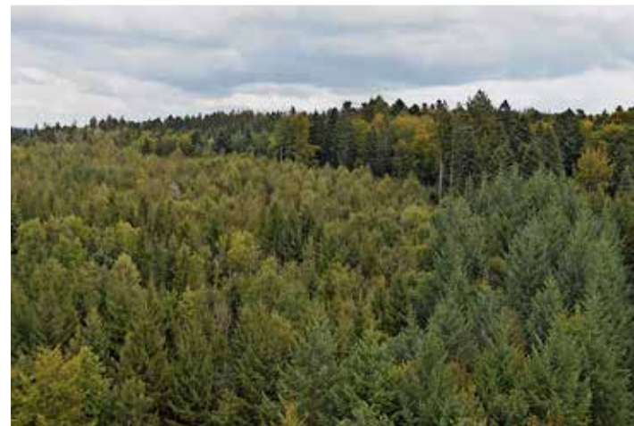
La forêt du Jorat fait partie des meilleures du Plateau. S. DEILLON

Quant à l'exploitation du bois, le garde forestier prend exemple du paysan qui a 50 ha